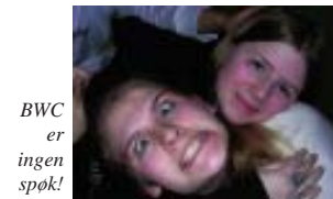
BWC er ingen spøk!