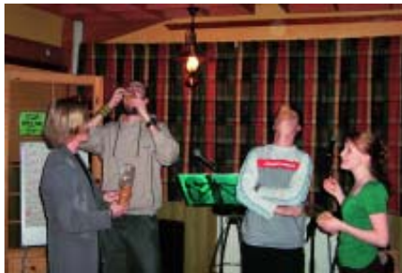
Mariekjeks-trikset er eldre en skolelaget....