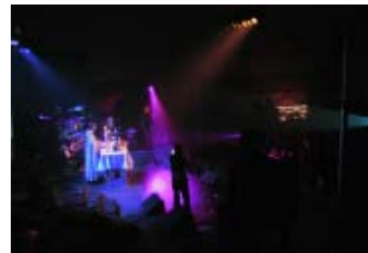
Ung Messe i ungdommelig belysning.