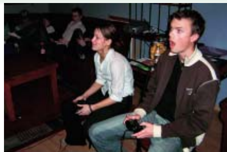
Bilspillturnering med X-box på storskjerm tar bare helt av...

Den sene kvelden vistest godt morgenen etter. Lederne måtte bruke mye energi på å få alle opp i tide for å være med på gudstjenesten.