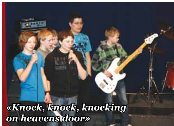
«Knock, knock, knocking on heavensdoor»